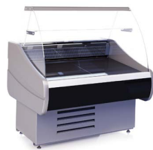
OCTAVA (0...+7 °C) СРЕДТЕМПЕРАТУРНЫЕ ВИТРИНЫ