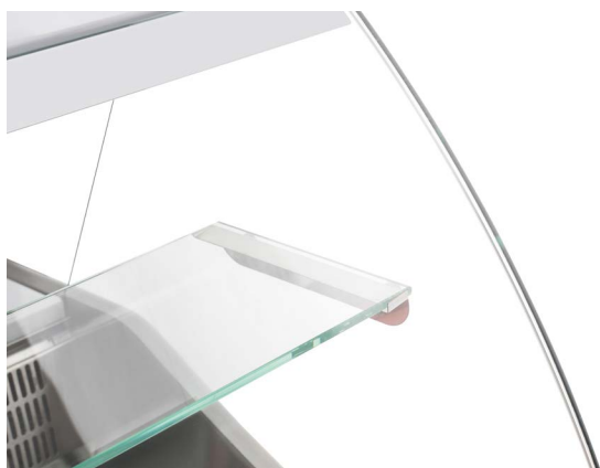
Усиленный профиль для дополнительной выкладки

Модель Octava — одно из самых экономичных и функциональных решений в своем классе, которое обеспечивает высокую эффективность использования полезной площади и экономичное энергопотребление. Octava разработана специально для оснащения торговых пространств небольшой площади.