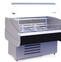
OCTAVA M (-15...-13 °C) НИЗКОТЕМПЕРАТУРНЫЕ ВИТРИНЫ