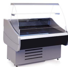
OCTAVA SN (-6...+6 °C) СРЕДНЕ-НИЗКОТЕМПЕРАТУРНЫЕ ВИТРИНЫ