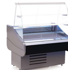
OCTAVA K (+1...+10 °C) КОНДИТЕРСКИЕ ВИТРИНЫ